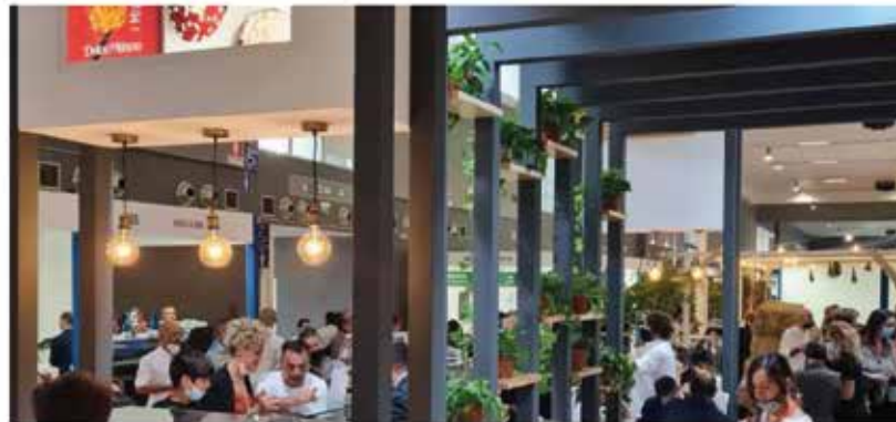
LA FIERA BIENNALE DELL'ENOAGROALIMENTARE

Fatti Fatti Italiani Fatto del Giorno NOTIZIATESTA Stranifatti