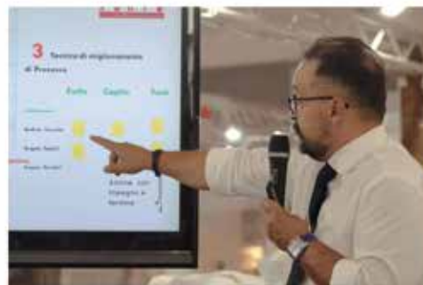
Roma Food Excel ( https://romafoodexcel.it/ ), l'unica e la più importante fiera di Roma dedicata al settore enogastronomico in programma nel prossimo marzo, viene rinviata al 24-27 aprile 2022 presso Fiera Roma.